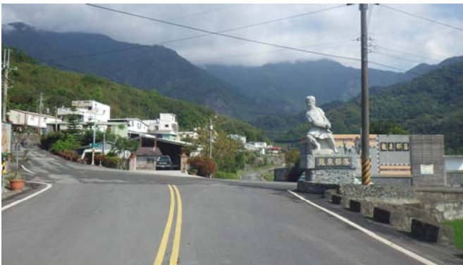
來到〔龍泉部落〕，左側就是〔龍泉派出所〕