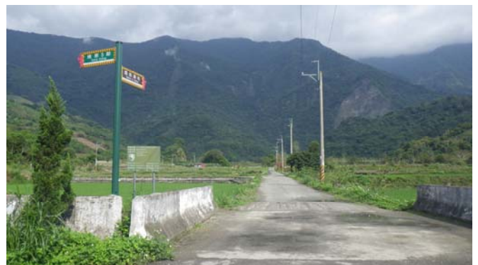
到達三叉路口，仍依〔龍泉瀑布〕指示牌直行