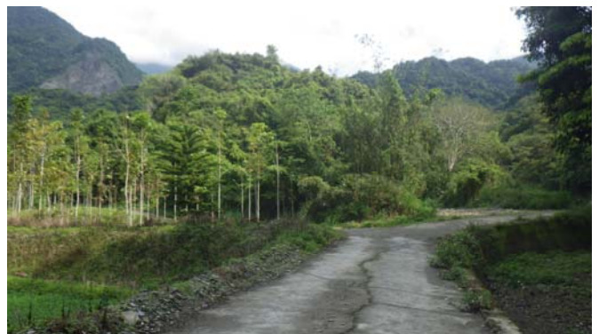
馬上又到三叉路口，這裡要左轉