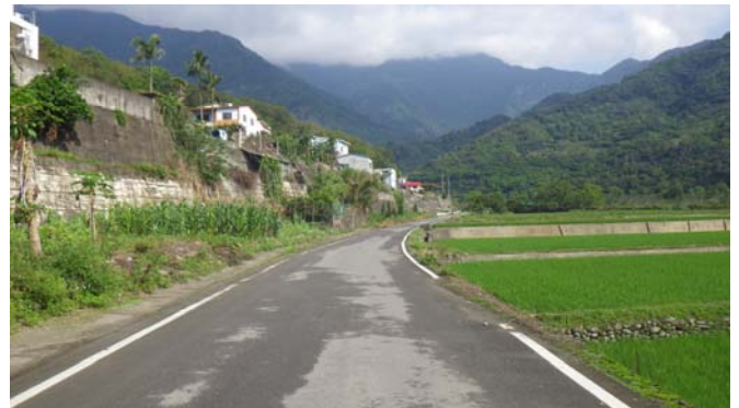
到達十字路口，依〔龍泉瀑布〕指示牌直行