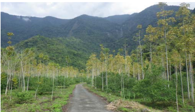
這一帶應是苗圃，龍泉瀑布高掛在前方山凹處