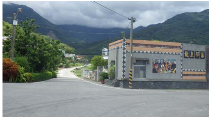
由龍泉部落活動中心旁小路直行