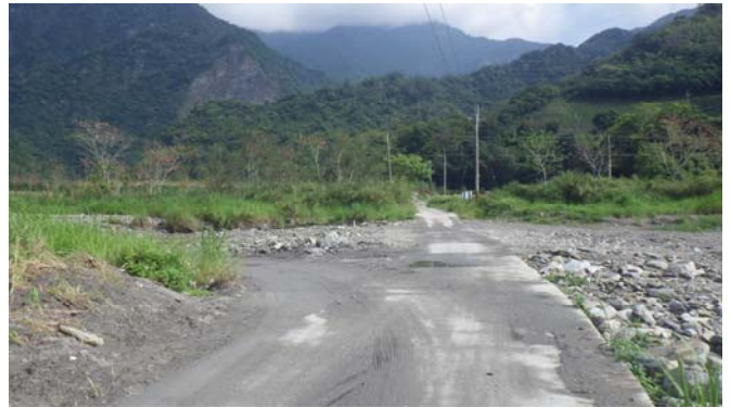
溪水大時，水會淹蓋掉水泥路