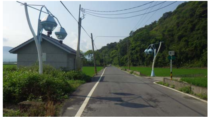
往龍泉部落這條路是〔東1〕縣道1公里處