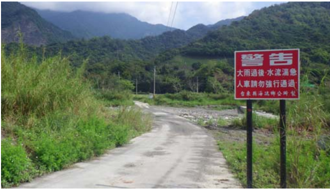
通過龍泉溪下游水泥路