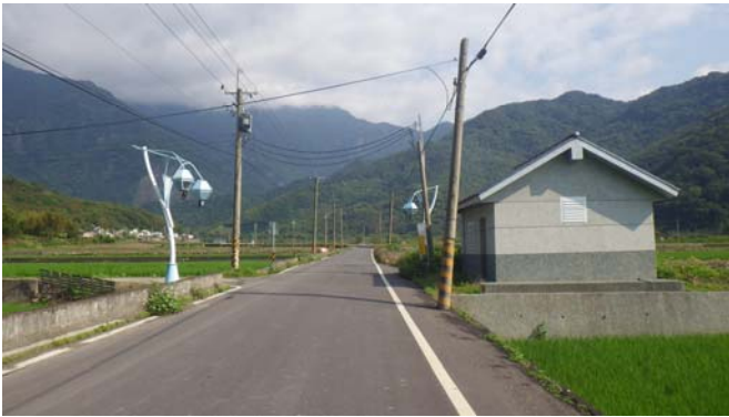
看到路口監視器，代表已進入海端鄉廣原村龍泉部落