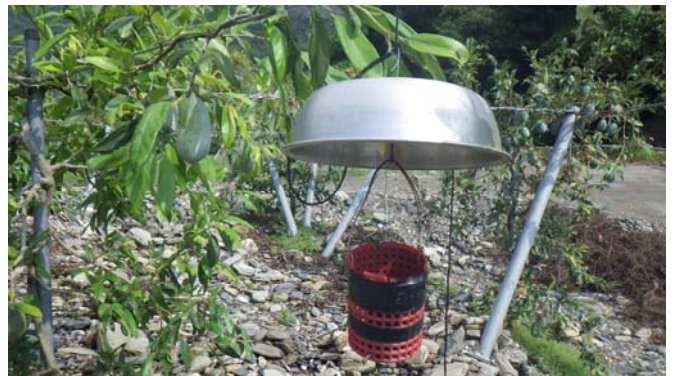
鐵盆下方小籃應是吸引昆蟲用，這果園種植著愛玉