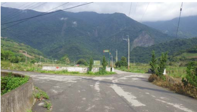
進來後的路口都設有往〔龍泉瀑布〕的指示牌