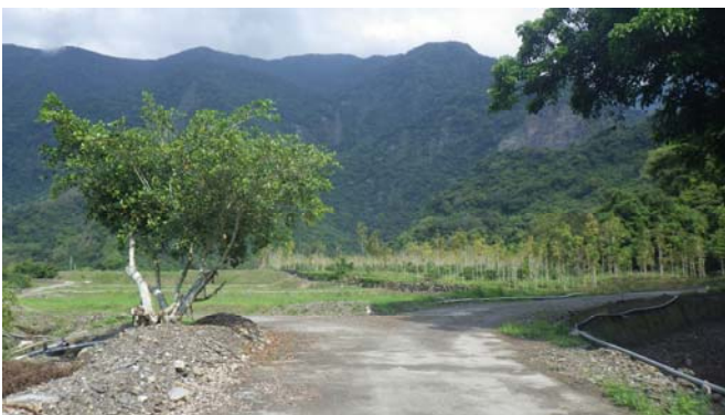
來到白榕三叉路口，右轉