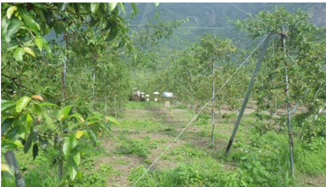
路旁的果園，發現特別處－到處都掛著鐵盆