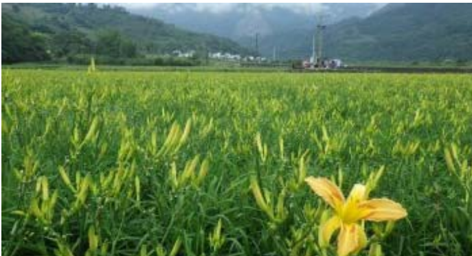
靠近龍泉部落兩旁水稻田中，也夾雜著金針田