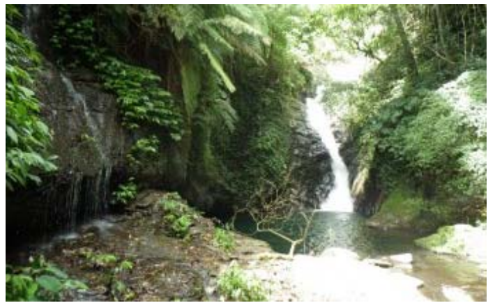
前面果真再出現第三條瀑布，真是太幸運了