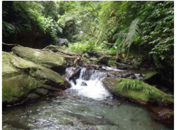
發現前面似乎有瀑布的聲、影