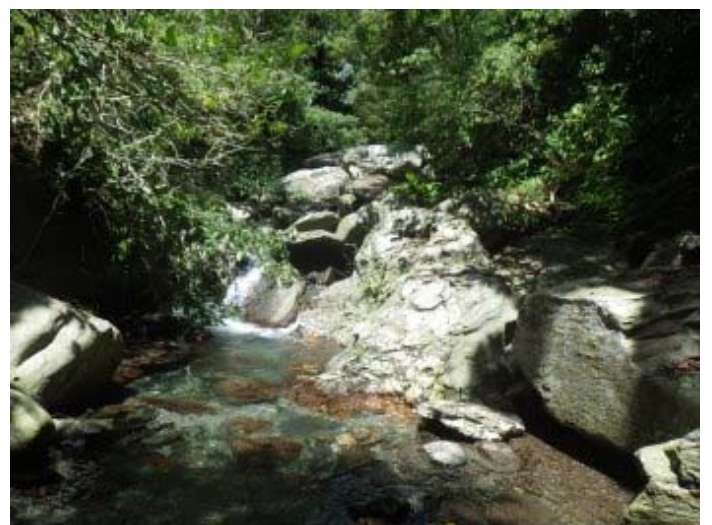
枯燥的路走了好一段，得找個地方當止溯點了