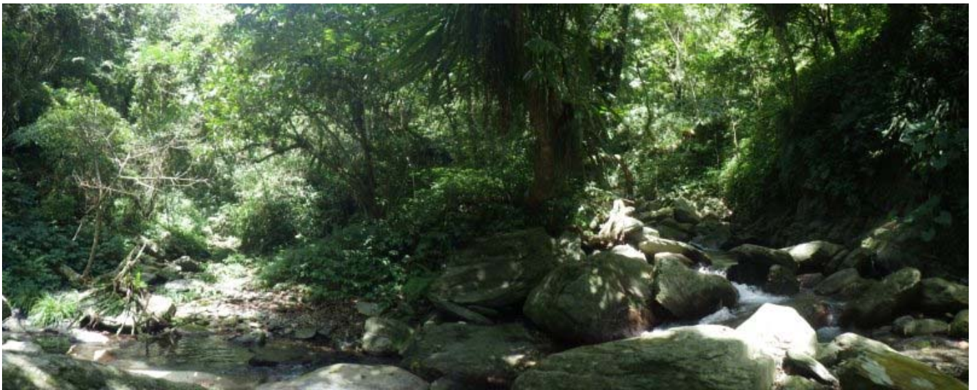
水道分流，左邊沒水，往右河道走