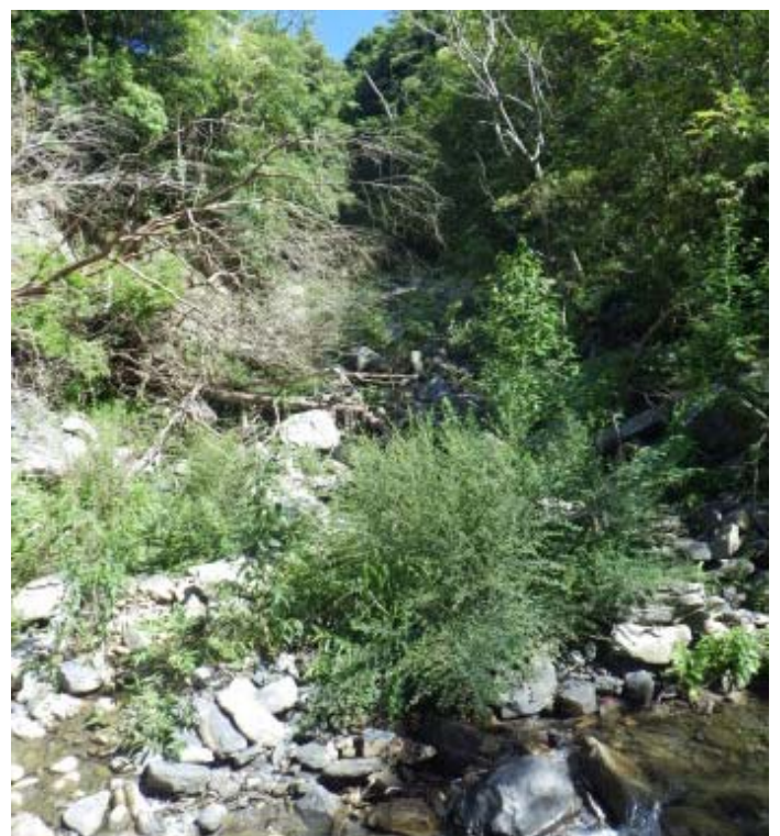
103 年來時，已變成一條土石流的乾溝