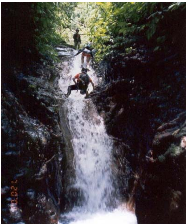
91 年來時，這溪溝很瘦長，可運用四肢攀爬而上