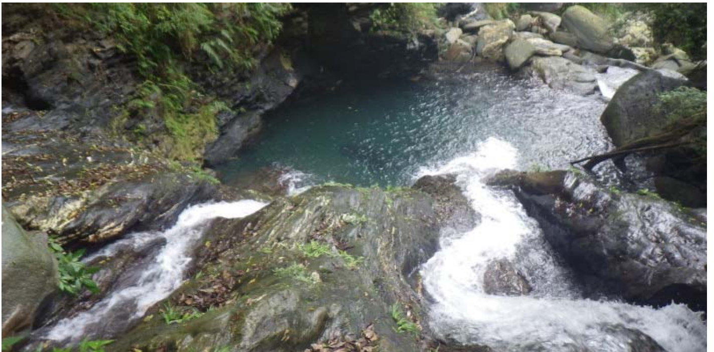
雙流瀑布上方下望