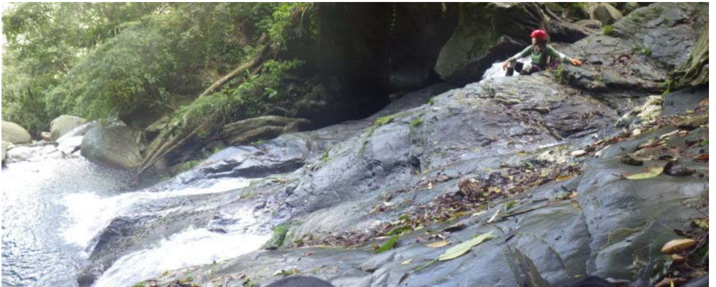
費了一番力量上來，小憩一下