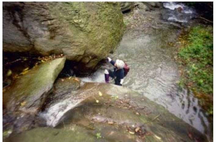
仍是繼續要不斷爬石而上