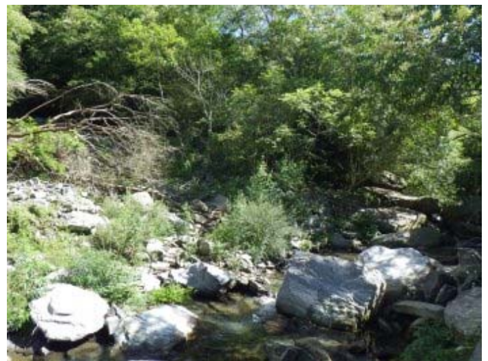
坍塌區，左邊有乾溪溝