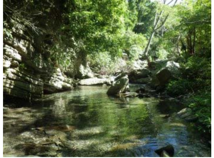
這一段溪谷變得寬闊，陽光整個照進來