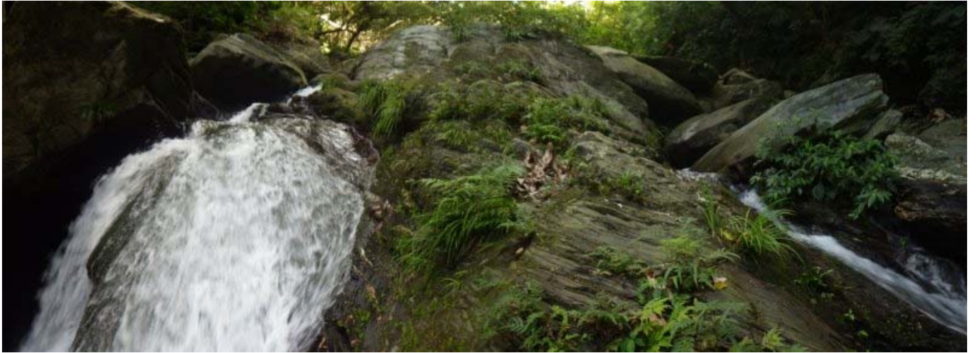
只要跨過水道，再上攀就容易了