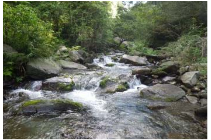
溪床中間有一棵顯眼的 澀葉榕