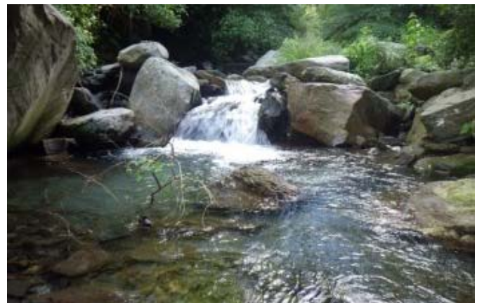
鹿鳴溪 水量穩定又清澈