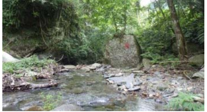
一旁石頭有做記號，有山路可繞過雙流瀑布