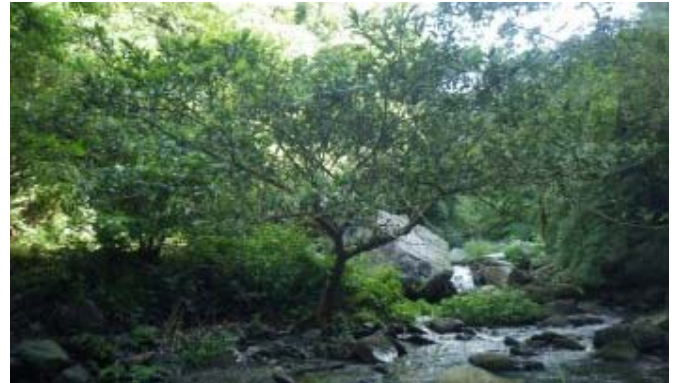
澀葉榕 的葉面密生剛毛，極度粗糙，可利用它來磨光器物；樹皮有韌性容易剝下，原住民用來製成樹皮衣。樹幹上小枝垂生，蠻特別的