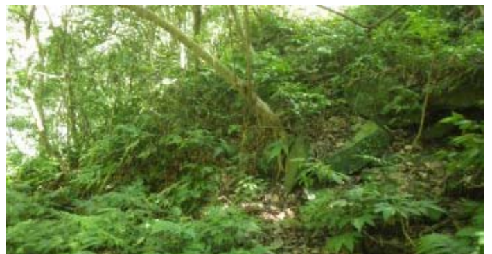
三叉路口 ，右上到更上游才下溪， 左轉 可很快下溪