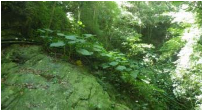
瀑布上方有些樹，或許可帶長繩索垂降到下方水潭