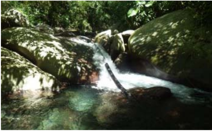
這裡的石頭變成紅色的，含鐵質較多