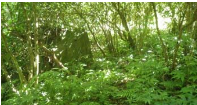
這裡有顆大石頭，可當路標