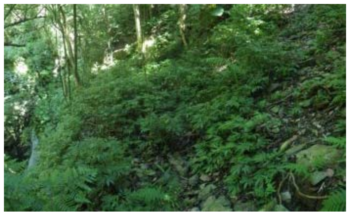
路徑平緩的橫繞，會接到瀑布上游溪床