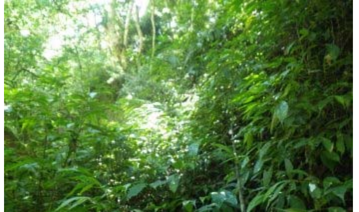
有架繩索的地方又陡又滑