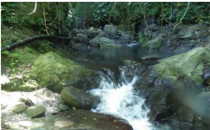
上溯一小段後，又發現人造物