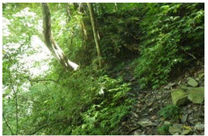
繩索過後路徑就平切而緩上