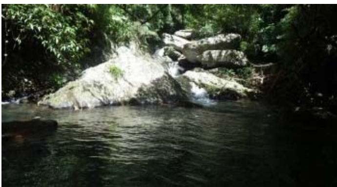
走了好一段，沒什麼特殊地形出現