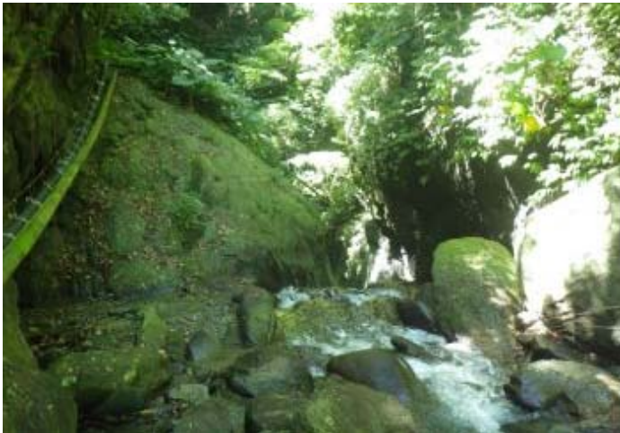
往下游走去瀑布的上端