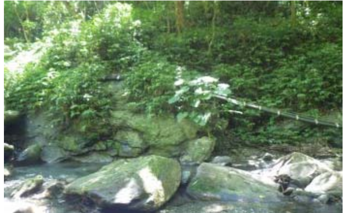
10:30 花了半小時，高繞路由此而下