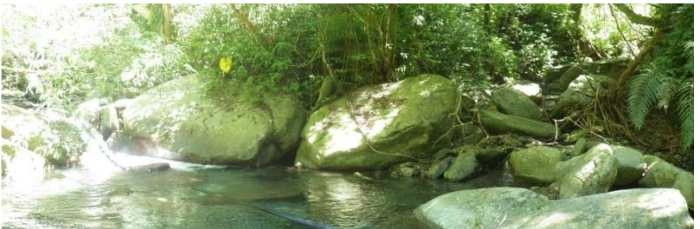
10:50 右邊出現一條溪溝，水量不多