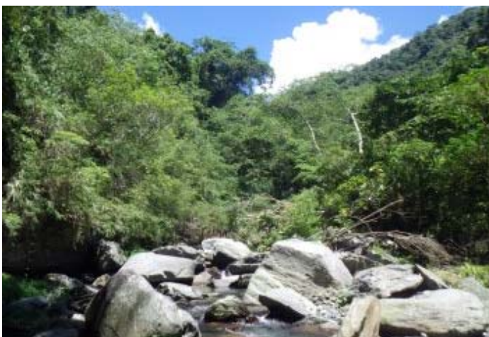
河床又再次變的開闊，陽光又再灑進來