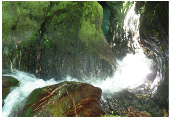
水流好急且底端還有凸起石塊，若滑瀑而下會有危險