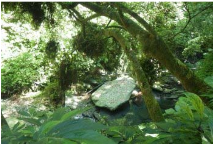
回望剛剛上來時的溪谷位置