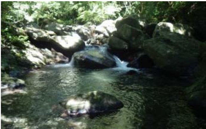
失去了追逐水管的目標，溯起來覺得有點枯燥