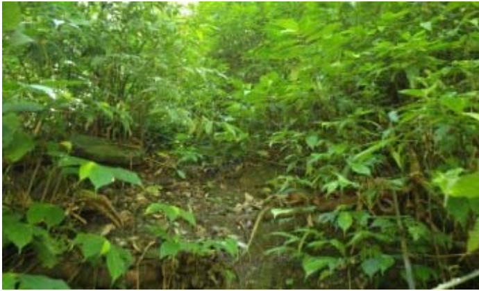
選擇往下游 左壁 的路，拉繩而上