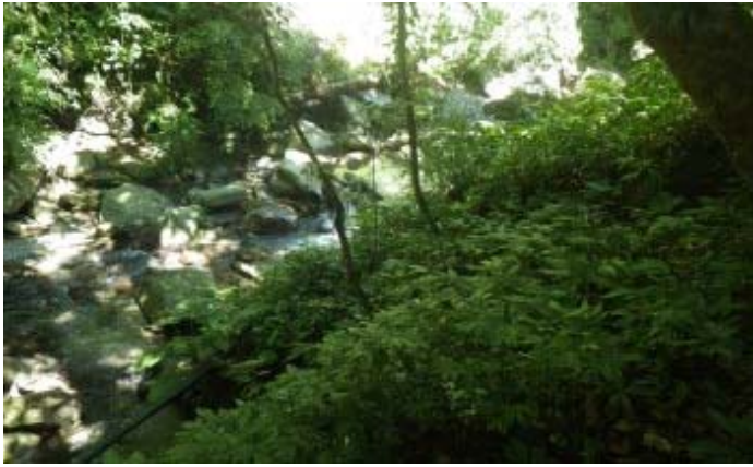
再回到瀑布上頭的溪床上