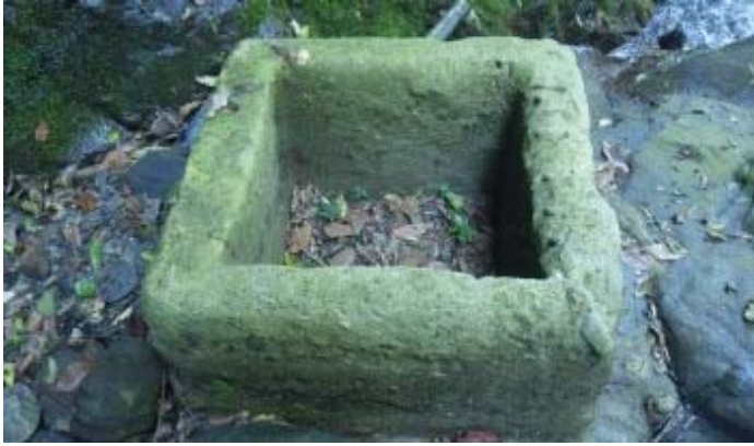
水泥設施應是沉沙池，已無作用