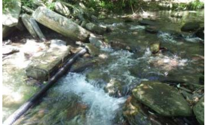
高繞下溪後再走 20 分鐘，水管在此結束