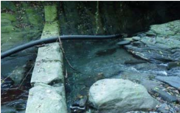
擋水牆，應是落石淤積造成功能被破壞