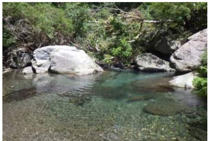
上游的水質仍然很好