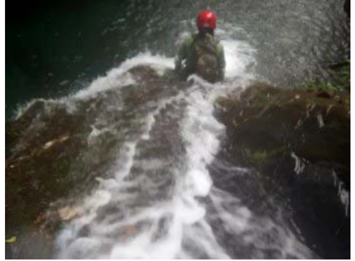
下瀑方式二：直接滑瀑而下（但這很容易撞到骨盆及大腿骨）