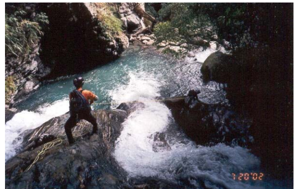
下瀑方式一：由領隊壓隊，將人一一先送下