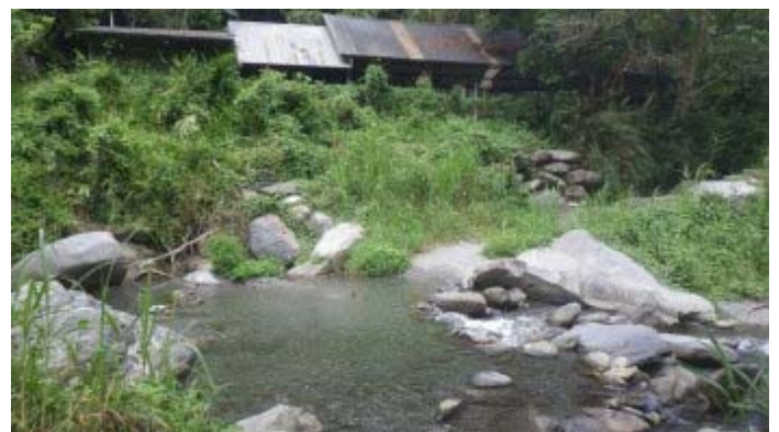
14:40 回到鹿鳴溪的起溯處，結束今天的溯溪