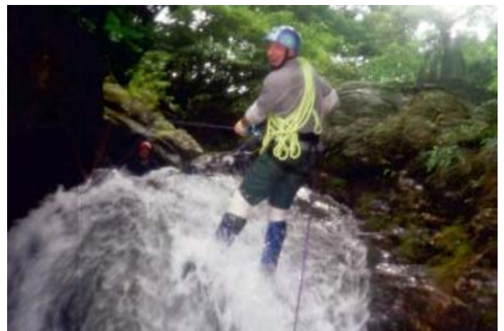
方式二：利用一旁石頭垂降而下