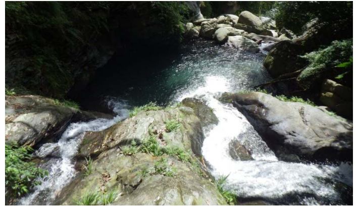
13:50 回到第一條雙流瀑布，高繞而下的路沒找到