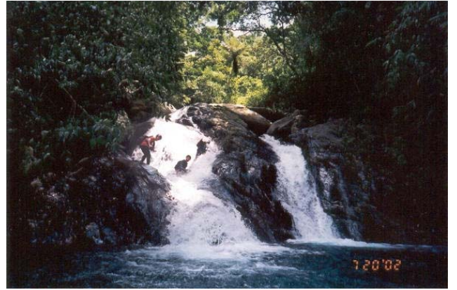
方式二：直接跳跨過水道