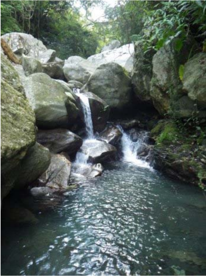
這裡的落差較大，費力爬上