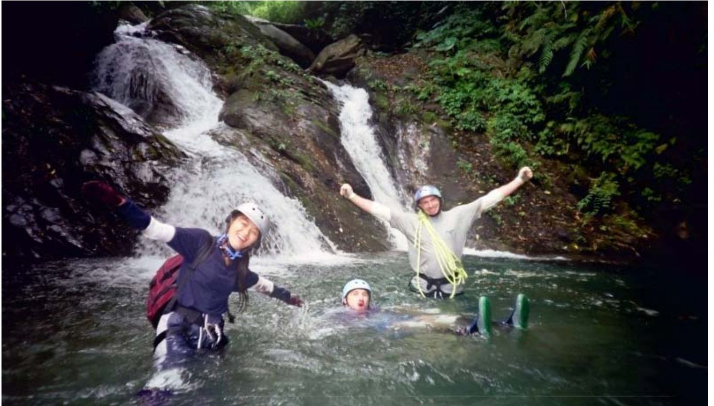
鹿鳴溪雙流瀑布，先拍張合照