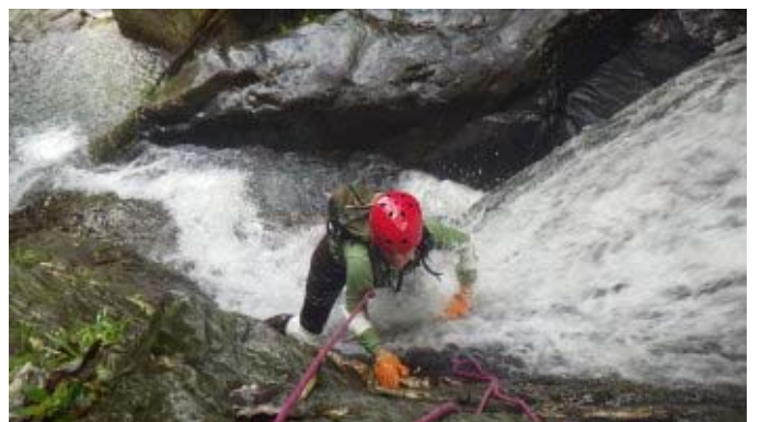
此處水流很強、岩壁很滑要小心