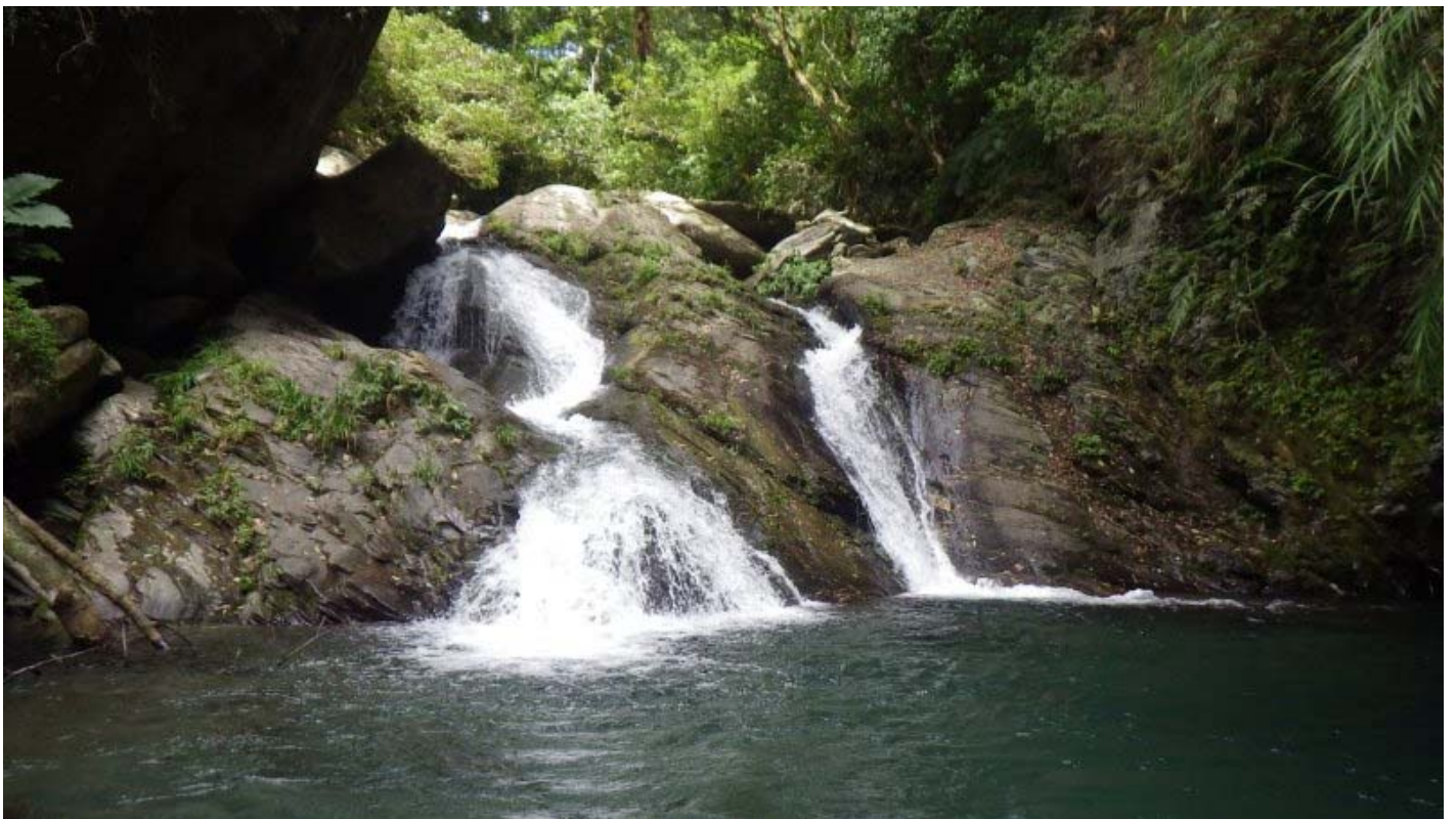
9:00 一小時抵達第一條雙流瀑布