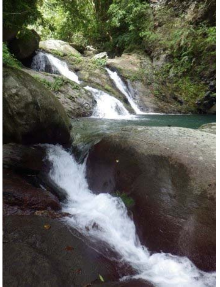
看到水潭及瀑布了