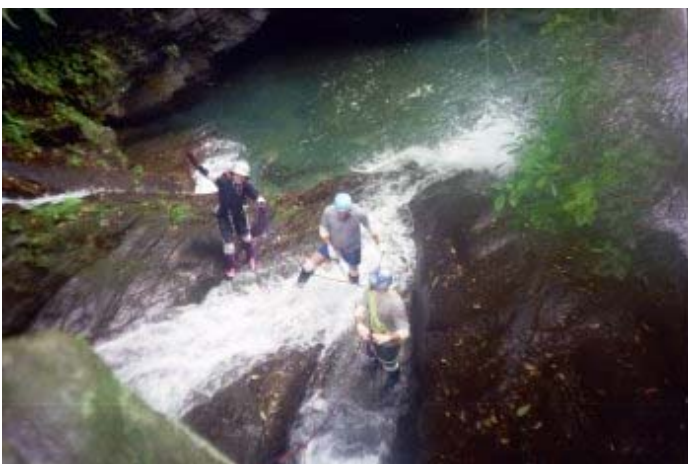
研究一下要如何上去