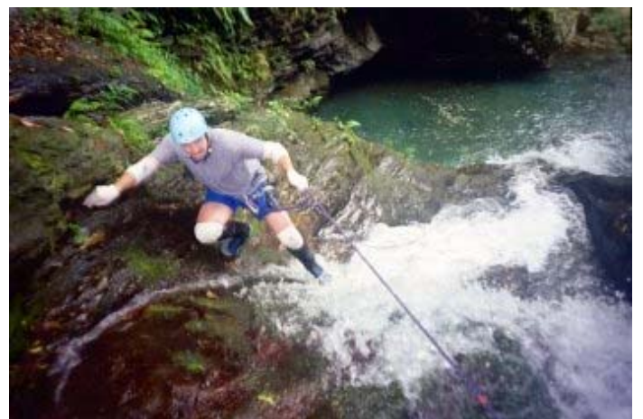
方式一：利用旁邊石頭繞住繩索，自己拉繩上來